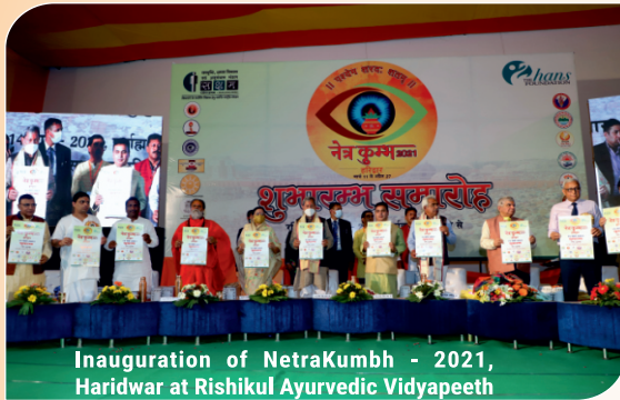
Inauguration of NetraKumbh - 2021, Haridwar at Rishikul Ayurvedic Vidyapeeth